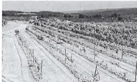
Parcel·la amb símptomes